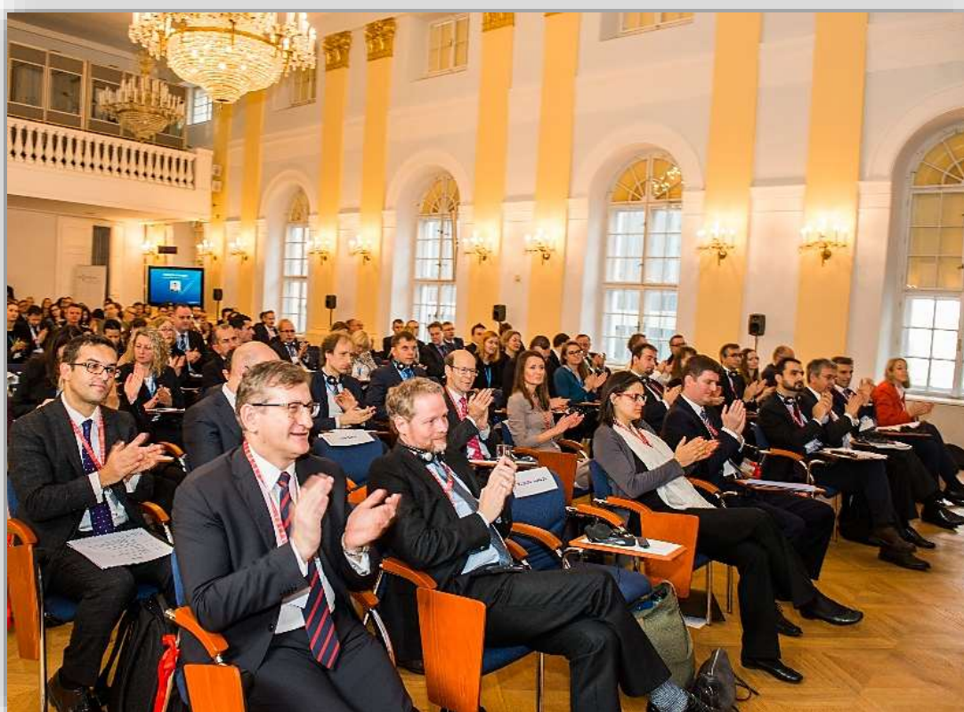
Hostia konferencie Európsky deň hospodárskej súťaže

zorganizoval pod záštitou predsedníctva Slovenskej republiky v Rade Európskej únie expertnú konferenciu s názvom European Competition Day - Európsky deň hospodárskej súťaže.