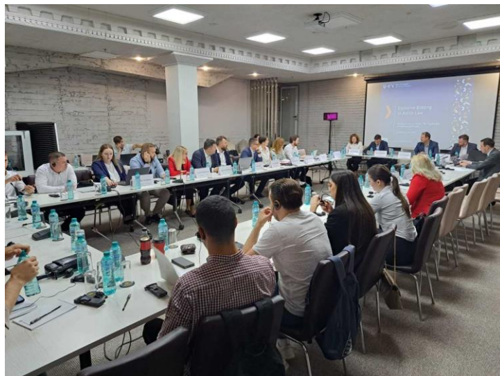
Obr. 6: Zástupcovia PMÚ SR sa podelili o skúsenosti a poznatky počas workshopu zorganizovaného UOKiK

Viac informácií o vzdelávacej aktivite zverejnil UOKiK na svojom webovom sídle: Workshop zorganizovaný UOKiK v Moldavsku .