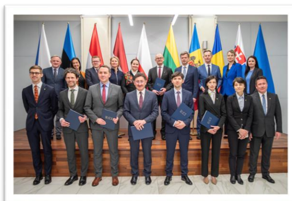
Podpísali sme memorandum o regionálnej spolupráci. Podrobnosti sú na s. 15 a 16.